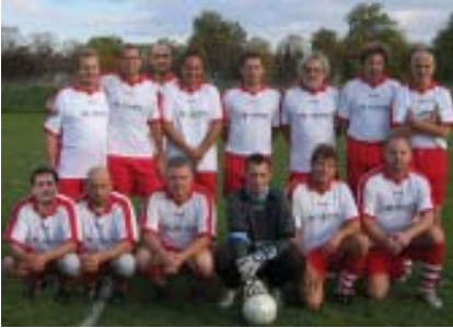
Unsere AH - derzeit in der Winterpause